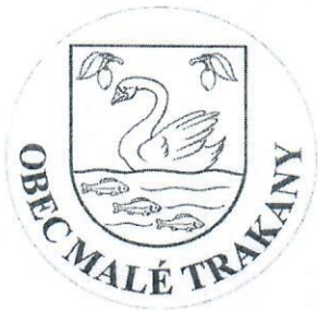
Vlajka a pečať obce